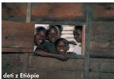
deti z Etiópie