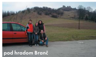
pod hradom Branč