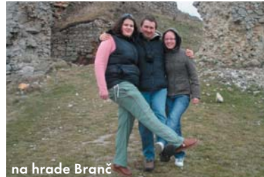
na hrade Branč