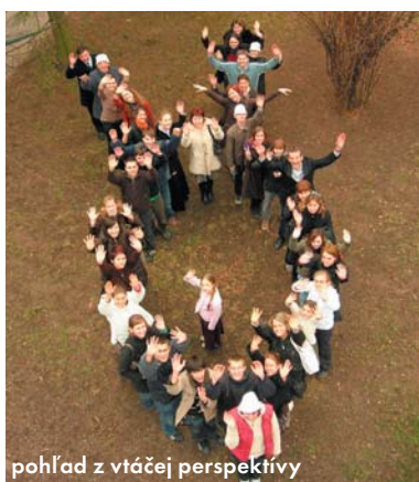
pohľad z vtáčejej perspektívy