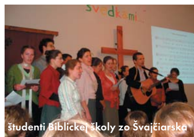
študenti Biblickej školy zo Švajčiarska