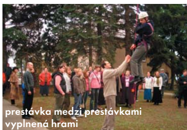
prestávka medzi prestávkami vyplnená hrami